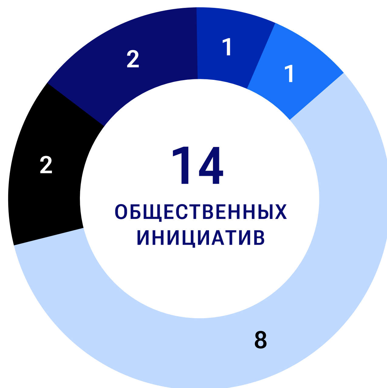
ПРОЕКТЫ И ИНИЦИАТИВЫ