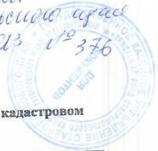
Схема расположения земельного участка или земельных участков на кадастровом плане территории Система координат: МСК-26 от СК-95 зона1

Решением министерства земельных отношений Ставропольского края от 13.11.13 № 376