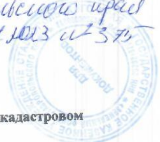
Схема расположения земельного участка или земельных участков на кадастровом плане территории Система координат: МСК-26 от СК-95 зона 1

решением министерства инфраструктуры и транспорта Ставропольского края от 13.11.2013 № 375