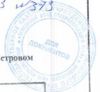
Схема расположения земельного участка или земельных участков на кадастровом плане территории Система координат: МСК-26 от СК-95 зона 1

решением исполнительного управления отделением Ставропольского края от 13.11.2023 № 373