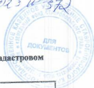
Схема расположения земельного участка или земельных участков на кадастровом плане территории Система координат: МСК-26 от СК-95 зона 1

Решением исполнительного исполнительных отделов Собрания сельского округа от 13.11.2023 № 197