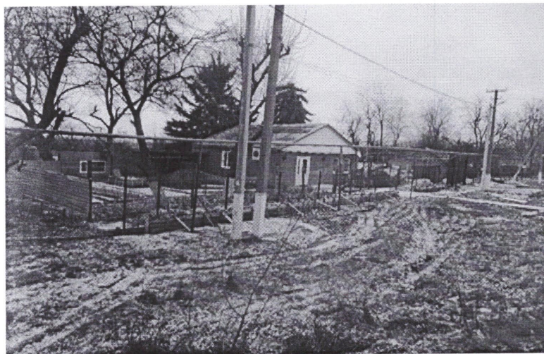
Фото нестационарного объекта