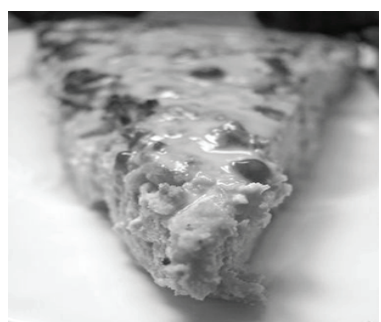
Рис хорошо промыть, залить водой и довести до кипения. Затем убавить огонь до минимума и варить, закрыв кастрюлю крышкой, приблизительно 25-35 минут, до испарения жидкости (рис получается немного липким). Разогреть духовку до 180 градусов. Яйца взбить с сахаром. Перемешать все ингредиенты запеканки. Рис добавить в самую последнюю очередь. Полученную массу вылить в форму (если нужно, смажьте форму маслом; если силиконовая - без масла). Запекать творожно-рисовую запеканку в духовке при температуре 180 градусов 40-45 минут.

Рис круглозерновой - 1 стакан (220-230 г) Вода (для варки риса) - 2,5 стакана (625 мл) Творог - 440-450 г Сахар - 100 г или по вкусу Яйцо - 3 шт. Ванилин - 1 пакетик (10-15 г) Цедра лимона (или апельсина) - по вкусу Изюм - 0,75 стакана (140-150 г) Молоко - 1,5 стакана (375 мл) Соль - 0,3-0,5 ч. л.