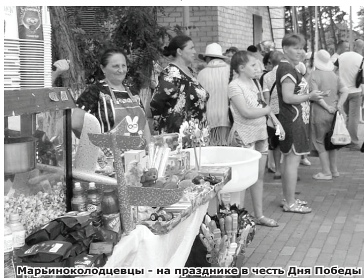
Марьиноколодцевцы — на празднике в честь Дня Победы

Вторая легенда «геологическая». Она рассказывает о том, что при выкапывании колодцев на глубине 5-7 метров попадались пласты белого минерала, кисловатого на вкус, который местные жители называли «марьины из колодцев», со временем преобразованное в Марьины Колодцы.