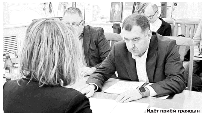
Идёт приём граждан