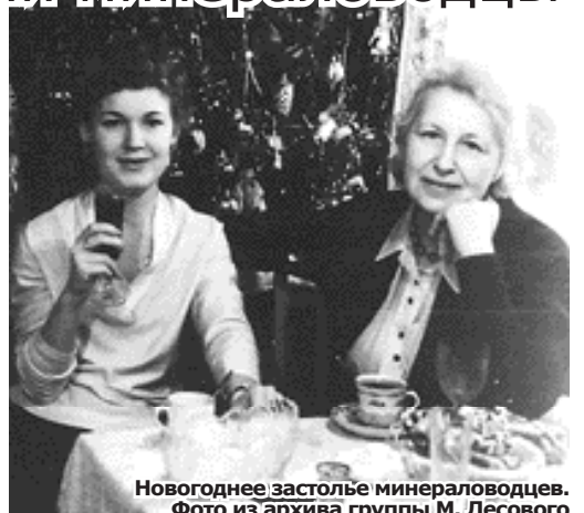
Новогоднее застолье минераловодцев.

— На эти ёлки, насколько я понимаю, ежегодно приглашали детей железнодорожников. У нас же город до недавнего времени делился, так