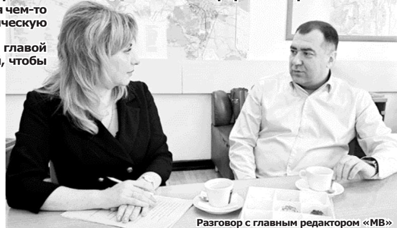
Разговор с главным редактором «МВ»

Многие города начали работать по ней, получали финансирование, а мы только разрабатывали проектную документацию и проходили экспертизу.