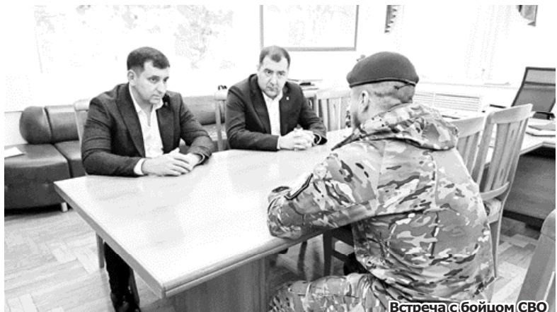
Встреча с бойцом СВО

Дороги, освещение и уборка территории — «три кита», на которых строится работа муниципалитета и по которым поступает наибольшее количество жалоб от людей