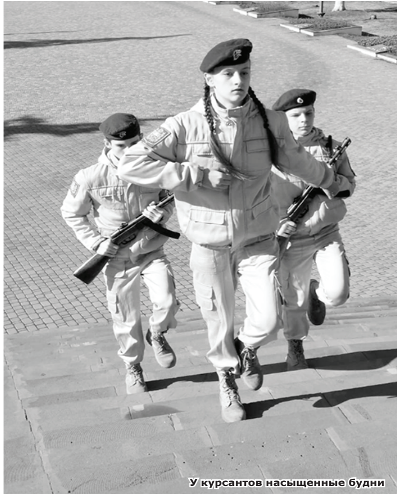
У курсантов насыщенные будни

В военно-патриотическом клубе «Честь» из городской школы № 1 и воспитанием чувства гражданской ответственности занимаются, и условия для выполнения служебного и общественного долга создают, и готовность защитить Отечество у ребят формируют. А ещё повышают физподготовку подростков и настраивают их на здоровый образ жизни.