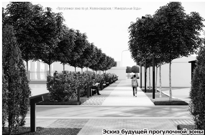
Эскиз будущей прогулочной зоны