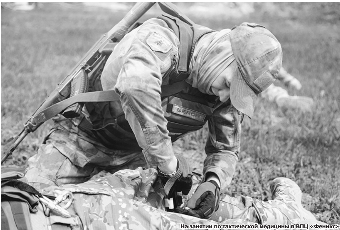
На занятии по тактической медицине в ВПЦ «Феникс»