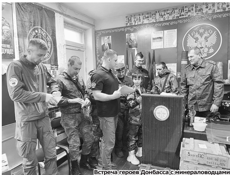
Встреча героев Донбасса с минераловодцами