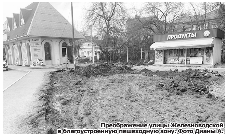
Преобразование улицы Железноводской в благоустроенную пешеходную зону.