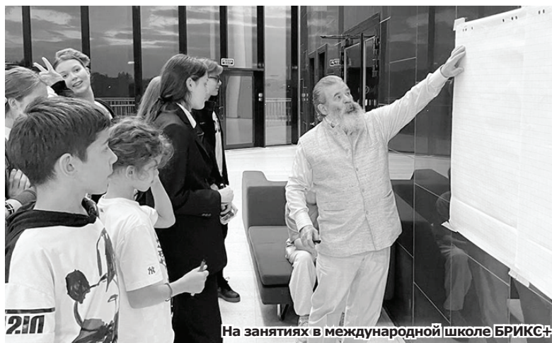
На занятиях в международной школе БРИКС+