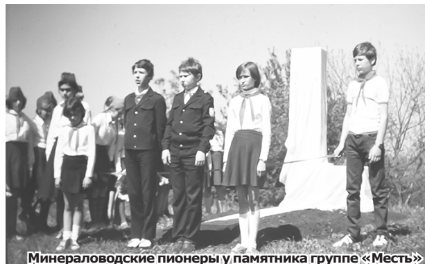
Минераловодские пионеры у памятника группе «Месть»