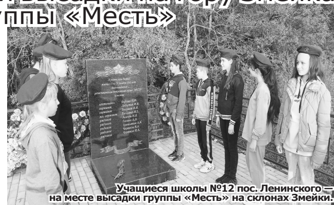
Учащиеся школы №12 пос. Ленинского на месте высадки группы «Месть» на склонах Змейки.