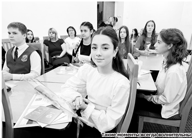
Такие моменты всегда волнительны