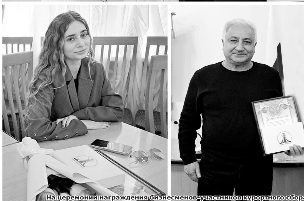
На церемонии награждения бизнесменов-участников курортного сбора