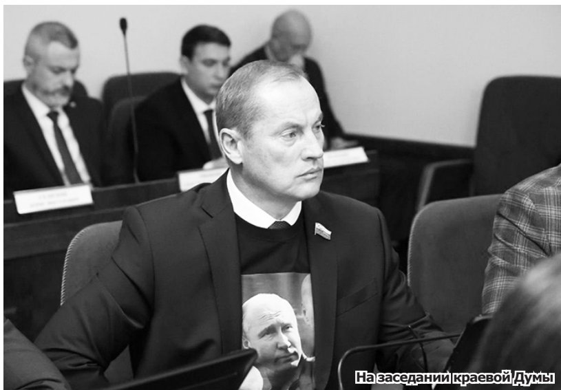
На заседании краевой Думы

социальных гарантий детям погибших бойцов. Теперь они будут предоставляться независимо от места проживания погибшего. Кстати, автором этой поправки был я (впервые выступил с законодательной инициативой в должности депутата). Обратил внимание на несправедливость: боец проживал или был прописан в другом регионе, потом погиб, а его ребенок-ставропонец не мог получить положенное, потому что отец, например, москвич. Теперь этот перекося устранили.