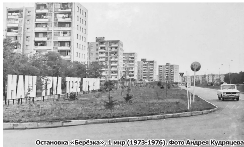
Остановка «Берёзка», 1 мкр (1973-1976).

В Путьском проезде, что за полотном железной дороги, сохранилась часть стены, что отделяла когда-то станционные постройки от Султановского посёлка. Это была так называемая «полоса отчуждения» железной дороги. Такая же стена шла и по нынешней улице Пушкина. Кстати, на Путьском проезде ещё сохраняются самые первые дома Минеральных Вод. Год постройки — 1874-й. Им уже 150 лет. Они старше, чем сам город...