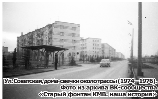
Ул. Советская, дома-свечки около трассы (1974–1976). Фото из архива ВК-сообщества «Старый фонтан КМВ: наша история»