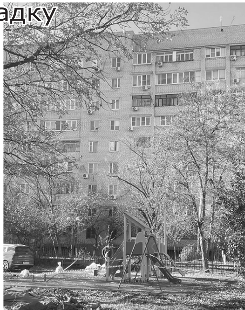
Строительно-ремонтные работы на детской площадке сквера «Дубрава»