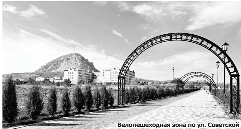
Велопешеходная зона по ул. Советской