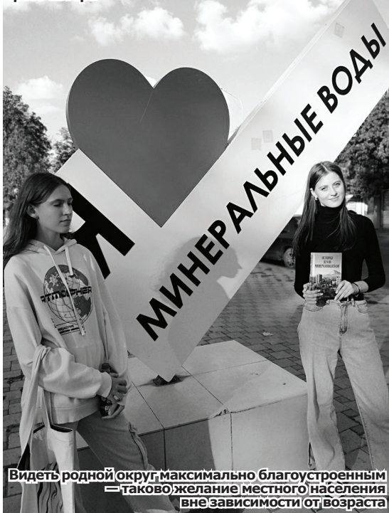
Видеть родной округ максимально благоустроенным — таково желание местного населения вне зависимости от возраста

ванного водоёма для купания. Многие признались, что ездят на железноводское или новопятигорское озёра. Водоём на территории округа, говорят, был бы очень кстати.