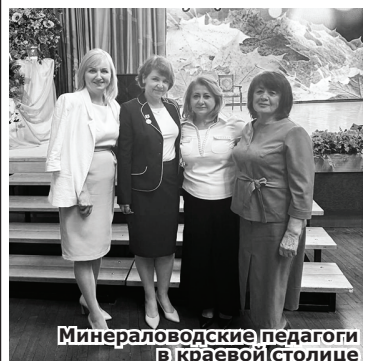
Минераловодские педагоги в краевой столице

Поздравляем всех педагогов с заслуженными наградами!