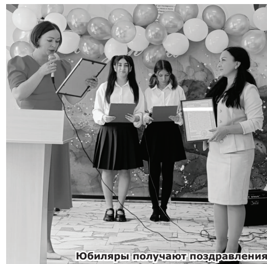
Юбиляры получают поздравления

Была Татьяна и активисткой тимуровского движения: на дому навещала участников вой-