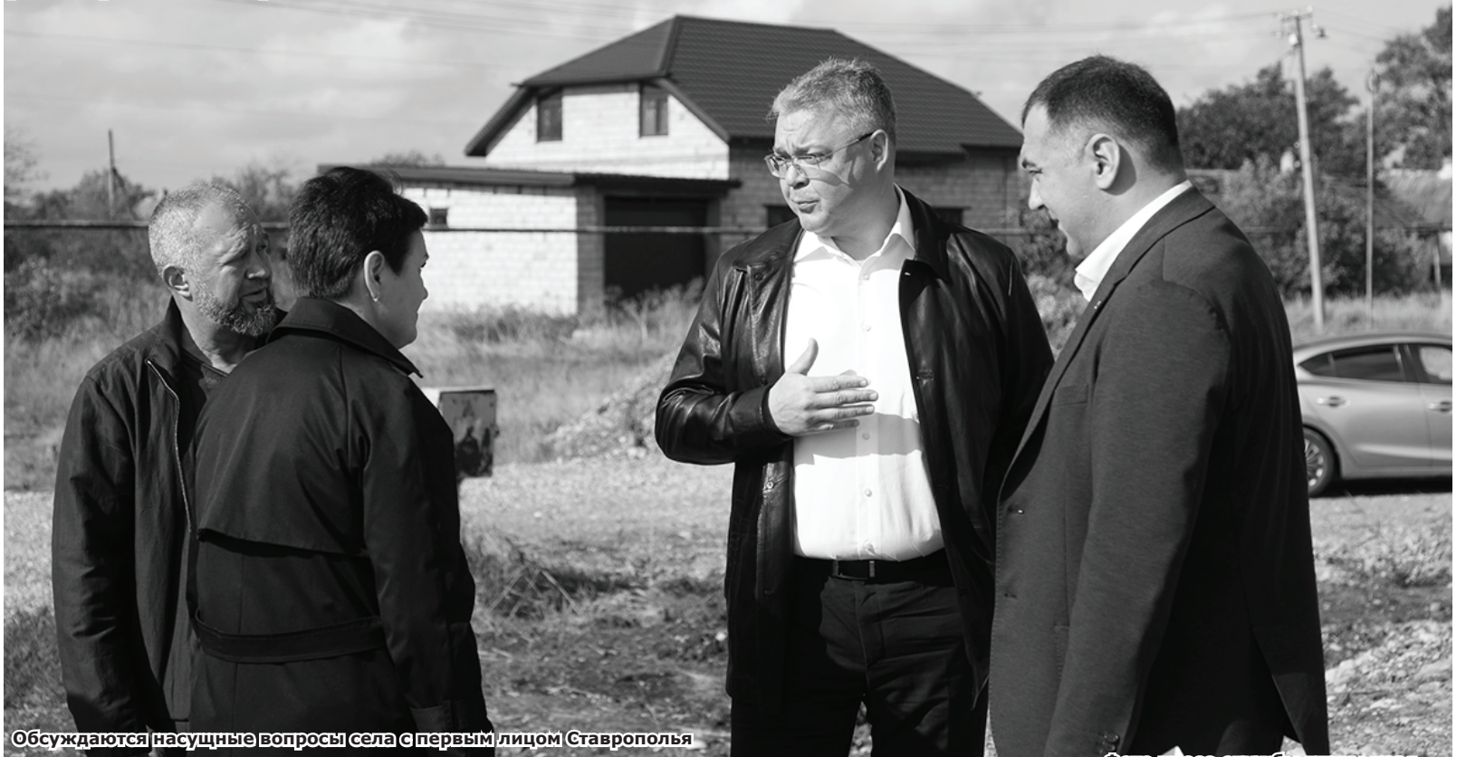
Обсуждаются насущные вопросы села с первым лицом Ставрополья

Владимир Владимиров совершил рабочую поездку в село Ульяновка.