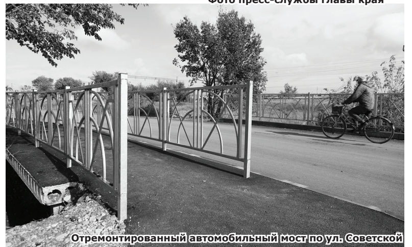
Отремонтированный автомобильный мост по ул. Советской

посетил сельский Дом культуры. Здесь в 13 творческих коллективах занимается более 200 детей, работает библиотека, действует концертный зал. Но здание нуждается в капитальном ремонте. Губернатор поручил министру культуры Татьяне Лихачёвой вместе с администрацией Минераловодского округа посчитать полную стоимость этого проекта и определить, что необходимо от-