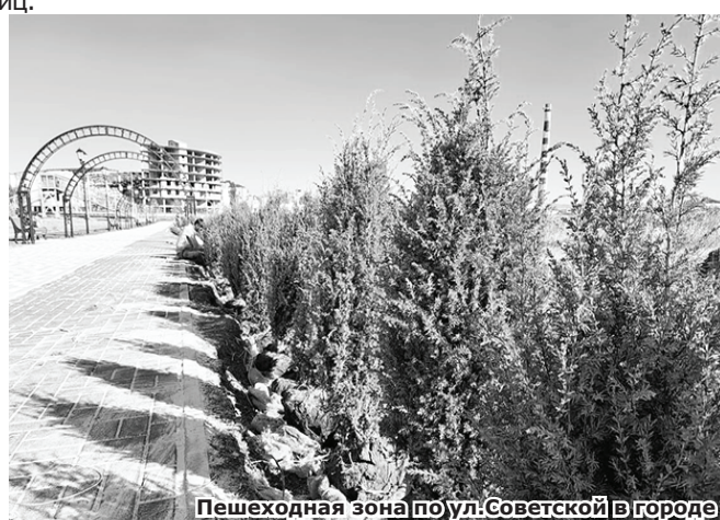
Пешеходная зона по ул. Советской в городе

Приступили в муниципалитете к высадке зелёных насаждений и вдоль