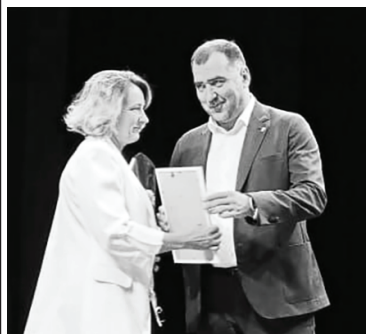
Врио главы округа награждает лучших педагогов