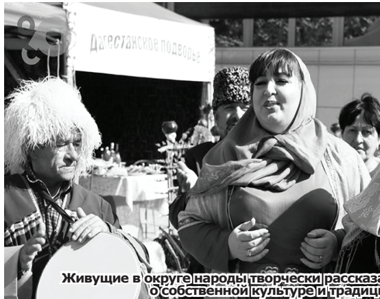
Живущие в округе народы творчески рассказали о собственной культуре и традициях.