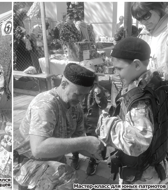
Мастер-класс для юных патриотов.