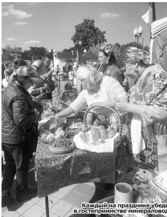
Каждый на празднике убедился в гостеприимстве минераловодцев.