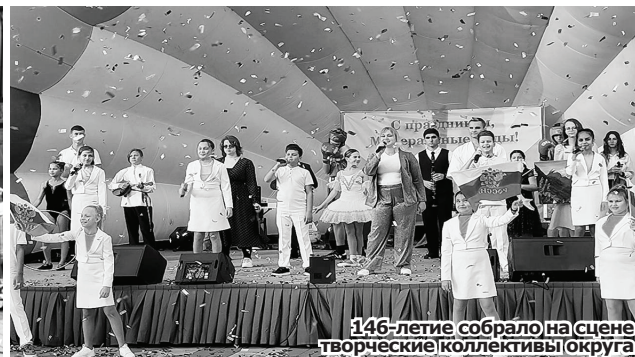
146-летие собрало на сцене творческие коллективы округа.