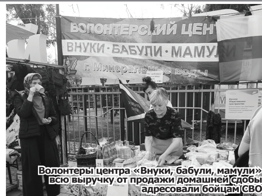
Волонтеры центра «Внуки, бабули, мамули» всю выручку от продажи домашней (сдобы) адресовали бойцам СВО