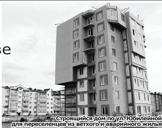
Строящийся дом по ул. Юбилейной для переселенцев из ветхого и аварийного жилья

Чаще всего — увеличивается. В Госдуме уже внесён законопроект о повышении ежемесячного МРОТ в 2024 году до 19 242 рублей.