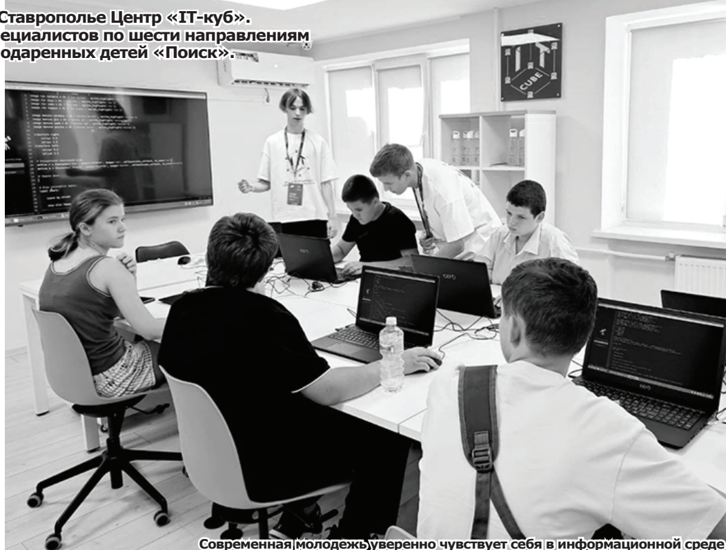
Современная молодежь уверенно чувствует себя в информационной среде

Подростки узнают, как проходит программирование роботов, программирование на Python, мобильная разработка, что такое кибергиена и работа с большими данными, изучат основы алгоритмики и логики, системного администрирования. Дополнительно представлены программы «Математика для информатиков» и «Шахматная гостиная».