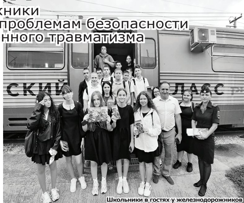
Школьники в гостях у железнодорожников

Школьники с интересом ознакомились с обустройством кабины машиниста, с технологией управления электропоездом. В учебно-тренажерном классе, где машинисты проходят тренинги перед выходом на линию, специально для ребят смоделировали нештатную ситуацию и