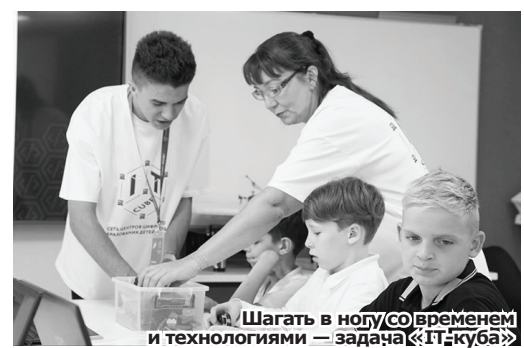
Шагать в ногу со временем и технологиями — задача «IT-куба»