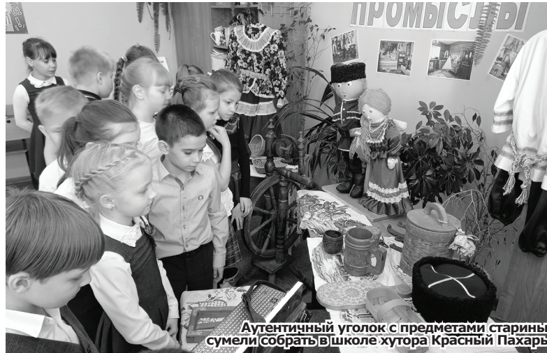
Аутентичный уголок с предметами старины сумели собрать в школе хутора Красный Пахарь