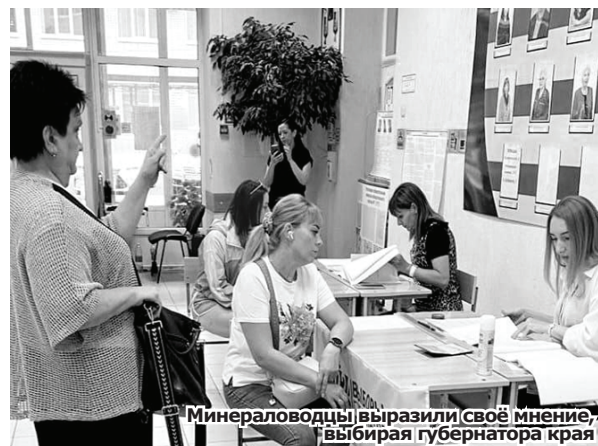
Минераловодцы выразили своё мнение, выбирая губернатора края

У кого не было возможности прийти на участок, могли проголосовать дома. Для этого нужно было обратиться в местную избирательную комиссию. Для людей с ОВЗ создали максимум условий: 97% избирательных участков в регионе расположились на первых этажах, на некоторых участках оборудовали спецкабины для голосования и работали сурдопереводчики. На 74 участках имелись бюллетени со шрифтом Брайля. Для удобства людей с ограничениями по здоровью работали волонтеры.