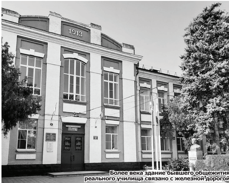
Более века здание бывшего общежития реального училища связано с железной дорогой

прямоугольные, однако, в зале второго этажа полуовальные, сверху украшены замком. Центральную часть здания венчает полукруглый фронтон. Карниз простой. Единственный элемент украшения — круглые, похожие