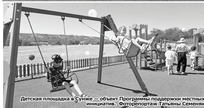
Детская площадка в Сунже — объект Программы поддержки местных инициатив. Фоторепортаж Татьяны Семеняк