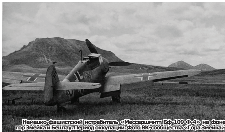
Немецко-фашистский истребитель «Мессершмитт Бф-109 Ф-4» на фоне гор Змейка и Бештау. Период оккупации.