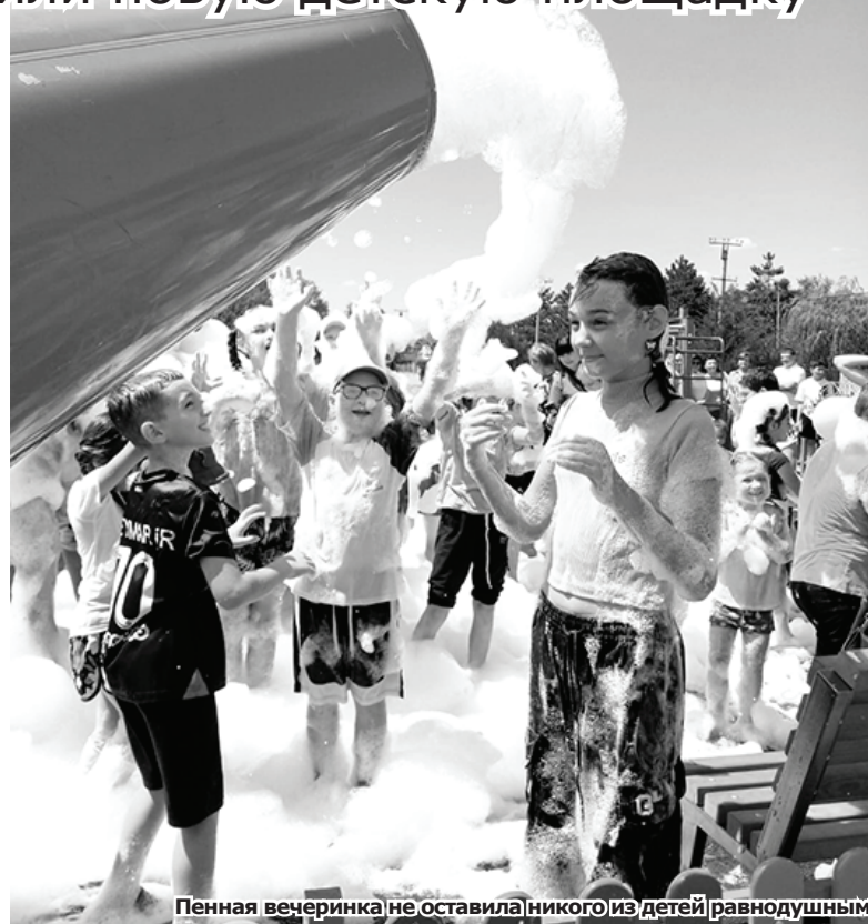
Пенная вечеринка не оставила никого из детей равнодушным