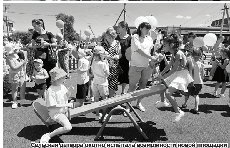
Сельская детвора охотно испытала возможности новой площадки