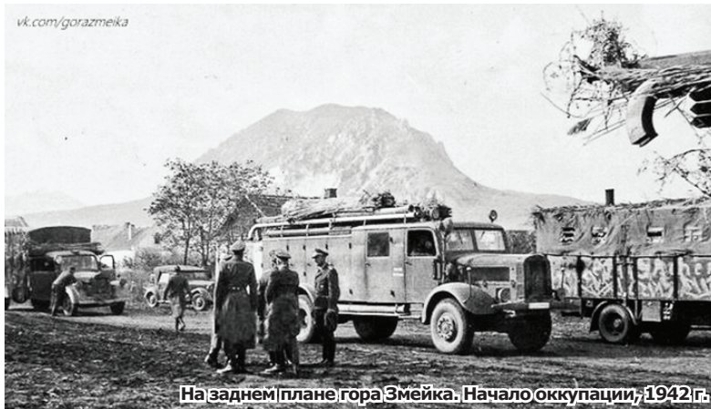
На заднем плане гора Змейка. Начало оккупации, 1942г.

На совещании обсудили обращения граждан, которые поступили в новогодние каникулы. К примеру, много вопросов по неработающему светофору на улице Московской. Поломка произошла из-за замыкания и выгорания порядка 90 метров СИПа. Проблему устранят до конца текущей недели.