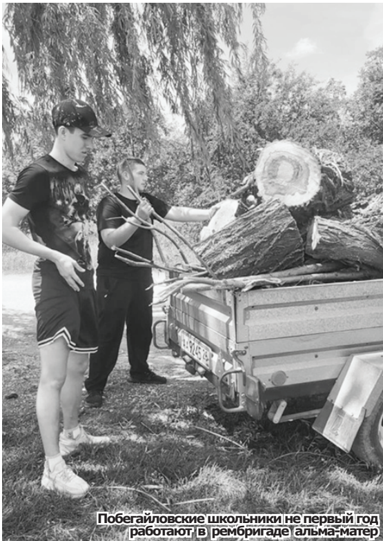
Побегайловские школьники не первый год работают в рембригаде альма-матер

городских школах (№ 1, № 111 и гимназия № 103) отработали 38 человек. Дети выполняли свои обязательства по договору в свободное от учёбы время.