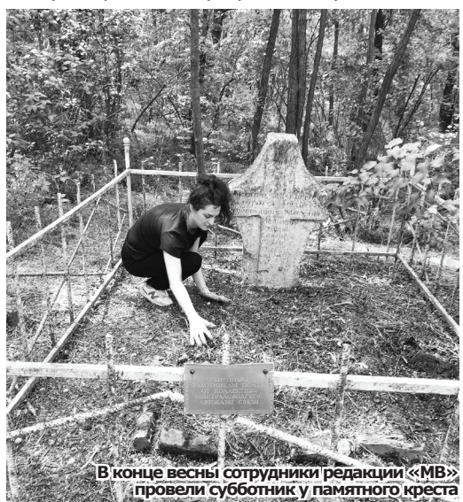
В конце весны сотрудники редакции «МВ» провели субботник у памятного креста

Звуки стрельбы взбудоражили двух шоссевых