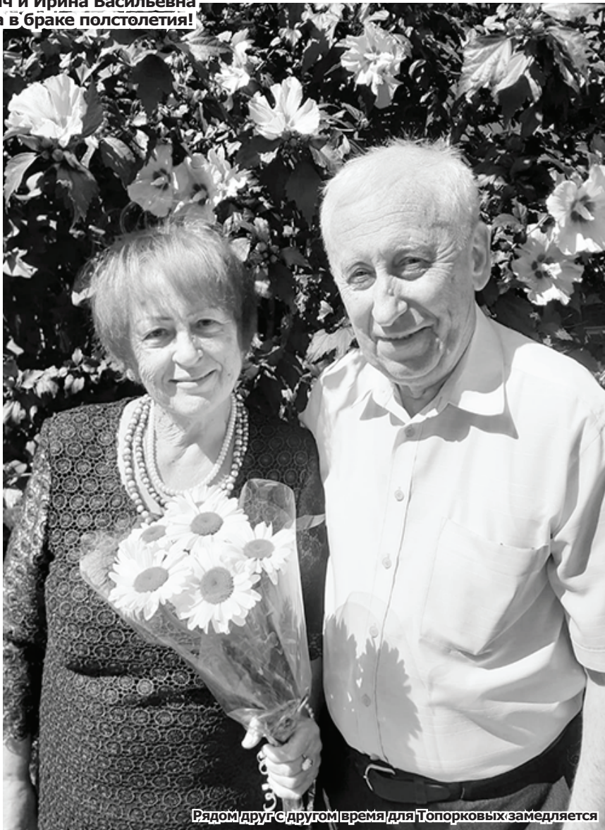
Рядом друг с другом время для Топорковых замедляется

Накануне Дня семьи, любви и верности в Минераловодском округе заключили брак девять пар.