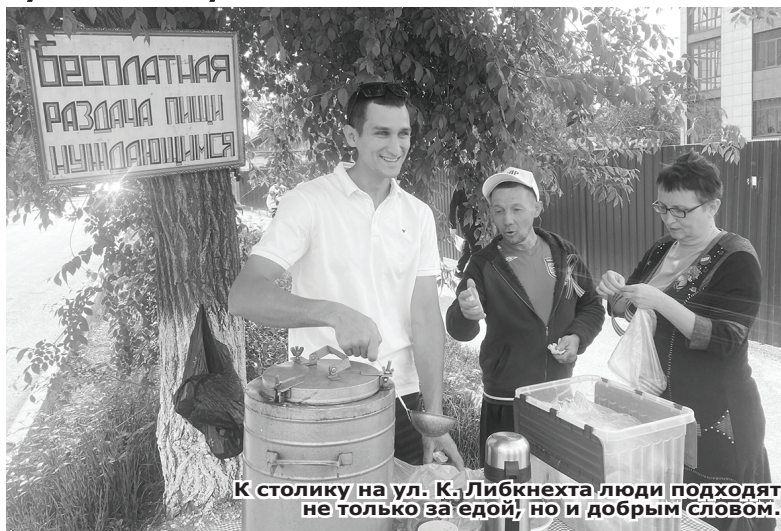
К столику на ул. К. Либкнехта люди подходят не только за едой, но и добрым словом.

При Центре имеется внушительное хозяйство: куры, утки, гуси, кролики. Есть даже корова. Молоко пьют, добавляют в кашу,