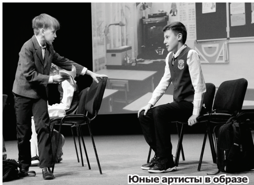
Юные артисты в образе

И хотя кружок никогда не ставил своей целью профессиональную подготовку актёров, желающих открыть для себя театр меньше не становится.