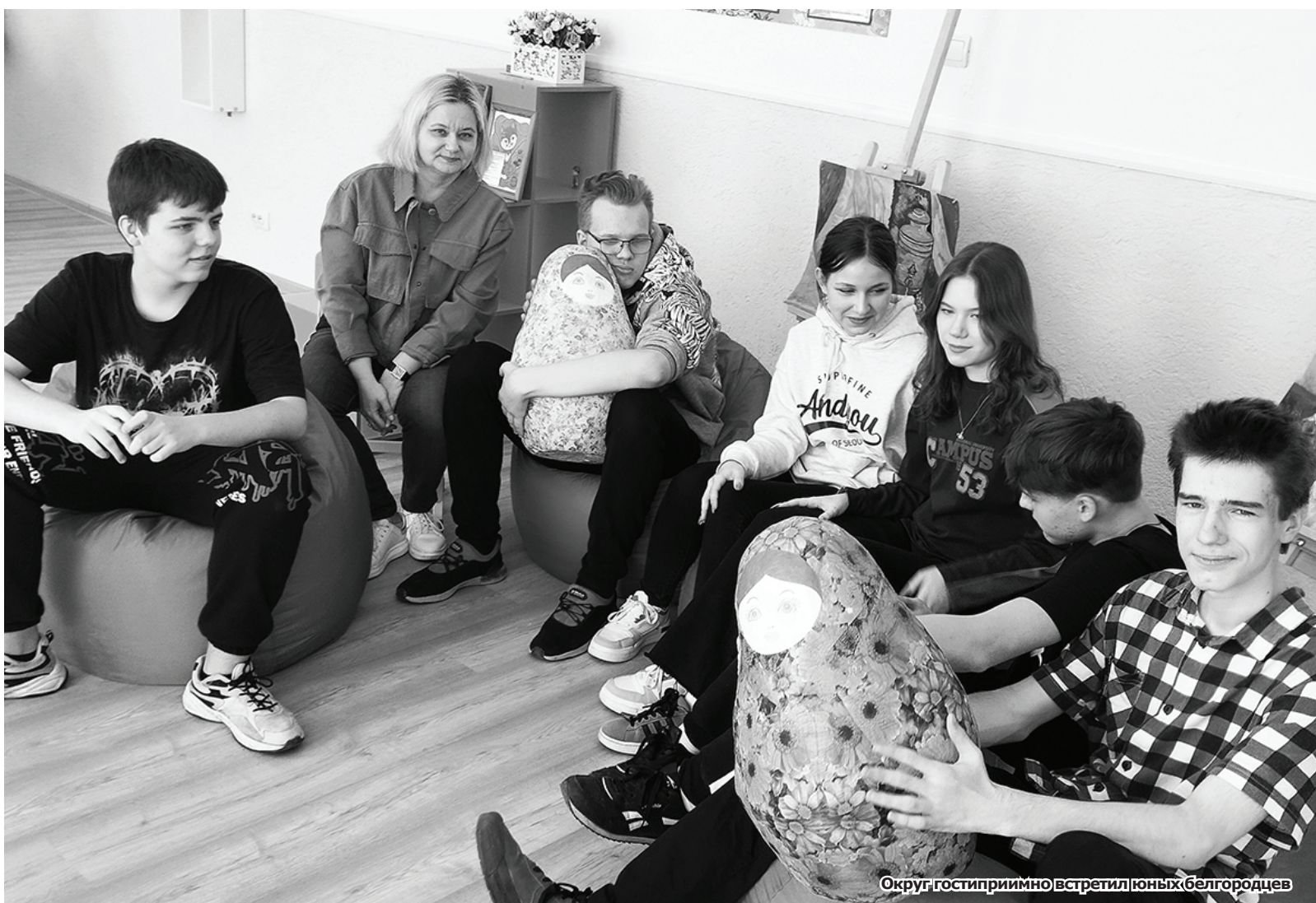
Округ гостеприимно встретил юных белгородцев