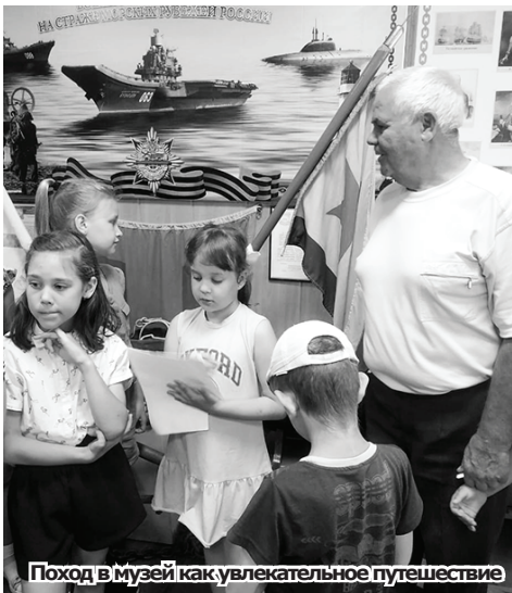
Поход в музей как увлекательное путешествие