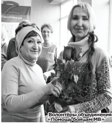
Волонтеры объединения «Помощь бойцам МВ»