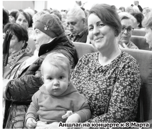
Аншлаг на концерте к 8 Марта