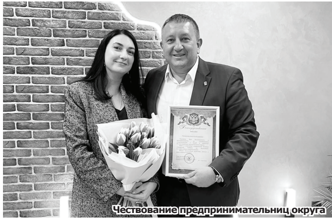
Чествование предпринимательниц округа