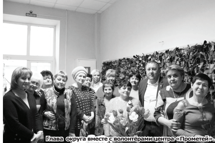
Глава округа вместе с волонтерами центра «Прометей»