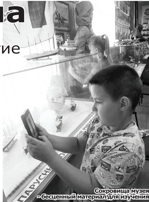
Сокровища музея — бесценный материал для изучения

Особый интерес вызывают стенд о жителях города, которые служили или состоят в рядах современной армии, морская художественная выставка с фоторепродукциями картин художников-маринистов от