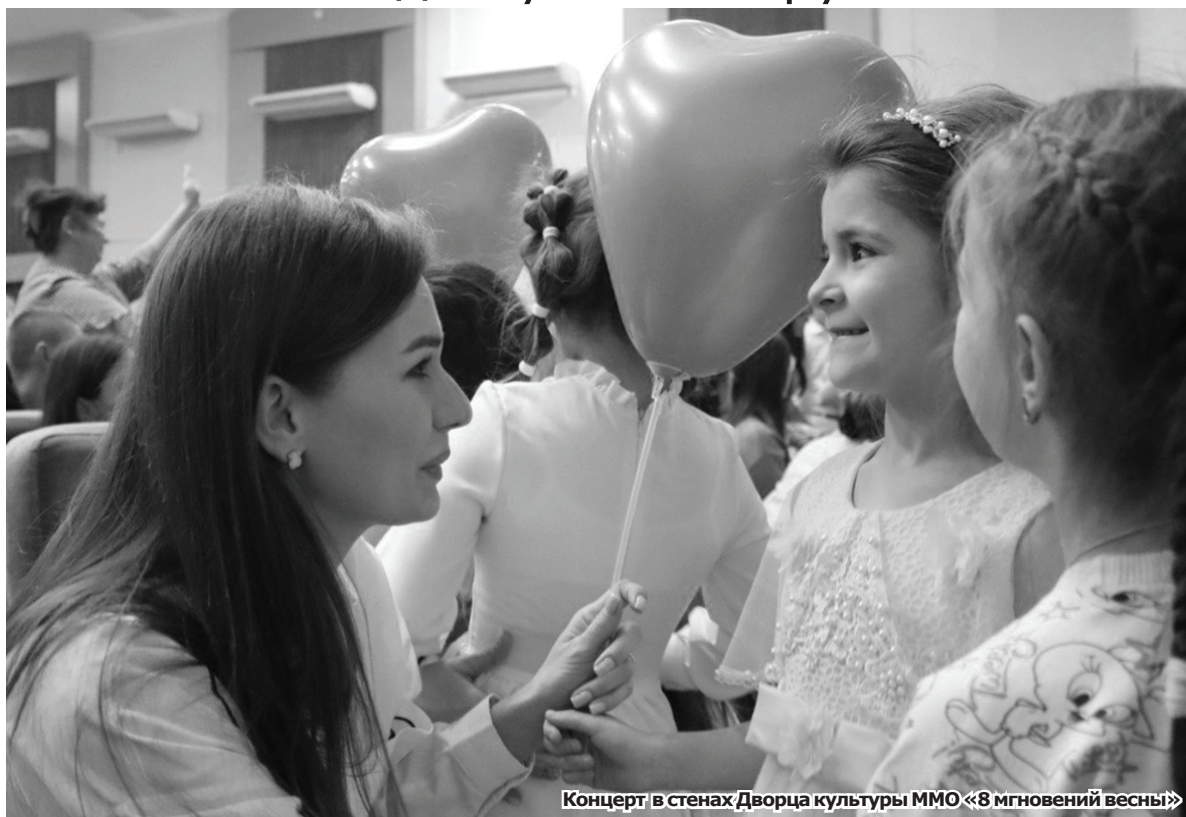
Концерт в стенах Дворца культуры ММО «8 мгновений весны»