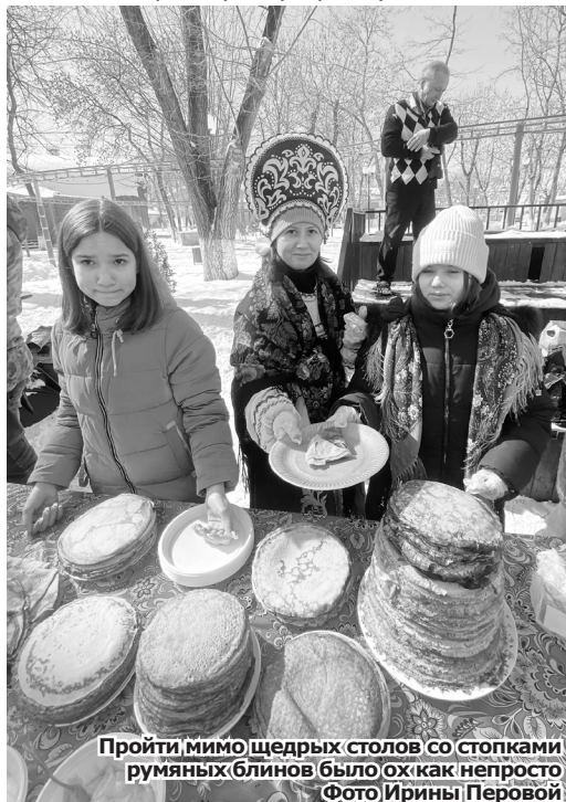
Пройти мимо щедрых столов со стопками румяных блинов было ох как непросто

Между тем, мини-музей «Русская изба» при ЦГБ хлебосольно распахнул свои двери взрослым и детям. По русской традиции гостей праздника встретили караваем и проводили в избу. Таким образом, культурно-познавательная программа «Возвращение к истокам» открыла Декаду русской культуры. В исполнении вокального ан-