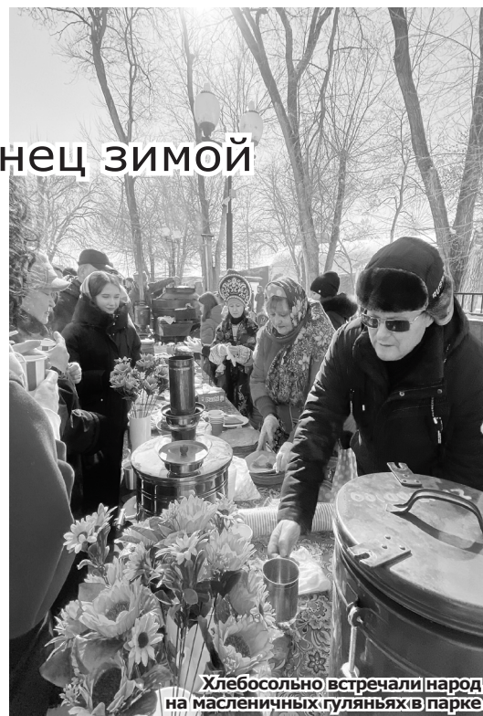
Хлебосольно встречали народ на масленичных гуляниях в парке