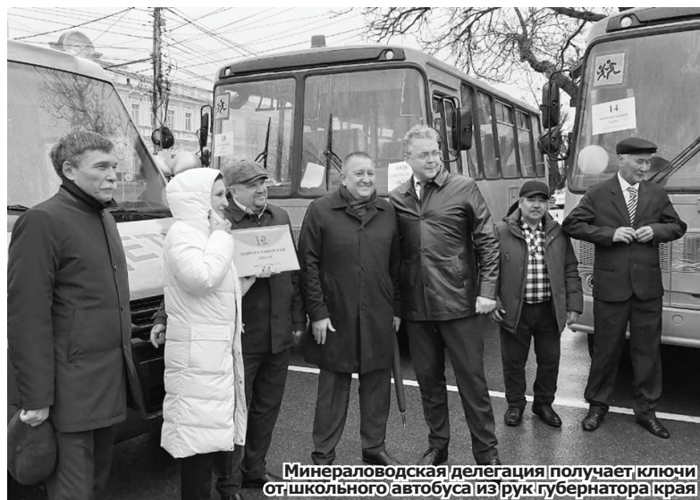
Минераловодская делегация получает ключи от школьного автобуса из рук губернатора края

Уверен, мы выполним планы текущего года по курортному сбору в 2024-м, это сумма порядка 11 млн рублей. Средства от него пойдут на улучшение инфраструктуры округа. Уже запланирована пешеходная зона со скамейками, светильниками возле Покровского