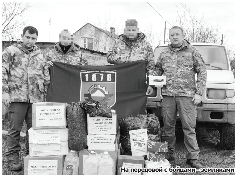
На передовой с бойцами - земляками

было реализовано 16 таких проектов. На следующий год заявили ещё 16. Из них 11 - уже прошли конкурсный отбор, получив подтверждение в финансировании из средств краевого бюджета. В 2025-м собираемся включить ещё 17 подобных проектов. Сами понимаете, такие амбициозные планы должны быть подтверждены софинансированием из местной казны. К примеру, в 2024-м потребуется сумма порядка 30 млн рублей.