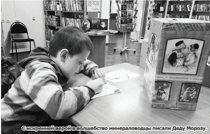
С искренней верой в волшебство минераловодцы писали Деду Морозу.

шебника, в добром здравии и благополучии. Были в почтовом ящике и такие послания, от которых мороз по коже. Авторы - дети - просили, чтобы помирились родители. Да, непростая у Деда Мороза работа... А в остальном утешает, что в новогодних посланиях есть вера в чудеса и волшебство, стремление к бодрости. Чего нет, так это отчаяния, злобы, сожаления.