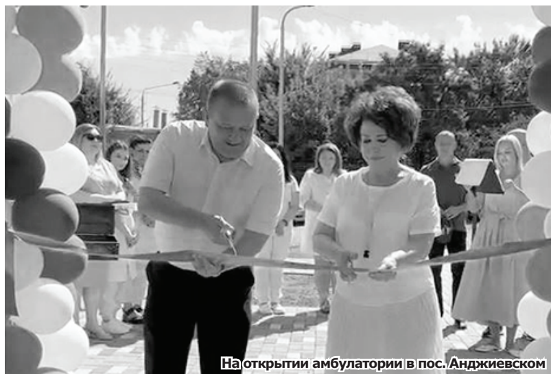
Наоткрытие амбулатории в пос. Анджиевском

Сумма приличная даже с учётом того, что в округе порядка 12 тысяч осветительных приборов. Добросовестность самих подрядных организаций и выполнение ими наших поручений – тоже вопросы, над которыми работаем. Планируем подключать народный контроль из числа местных жителей, с которыми поддерживаем связь в соцсетях. Плюс со следующего года закрепим дополнительные функции контроля непосредственно за территориями, которым поставим задачу обеспечивать достоверность информации о наличии проблем на территории и их решении.