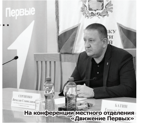
На конференции местного отделения «Движение Первых»

С этого года в бюджете округа предусматриваются денежные средства для участия практически во всех программах, существующих в Ставропольском крае.