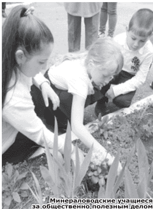
Минераловодские учащиеся за общественно полезным делом

было советское детство с дежурствами по классу и в школьной столовой, летней практикой на пришкольном участке, субботниками, сбором макулатуры.