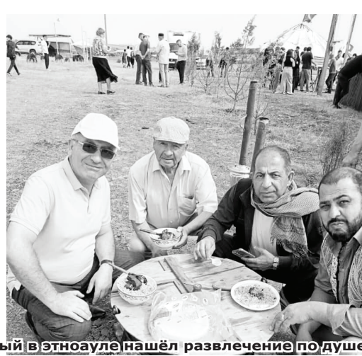
Каждый в этноауле нашёл развлечение по душе