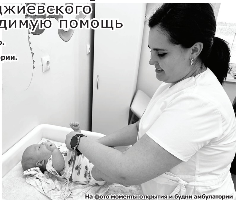
На фото моменты открытия и будни амбулатории